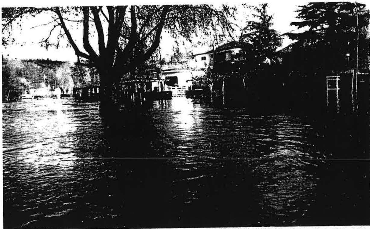
Inondation du 20 janvier 1998 - Barnabé – Périgueux 24-